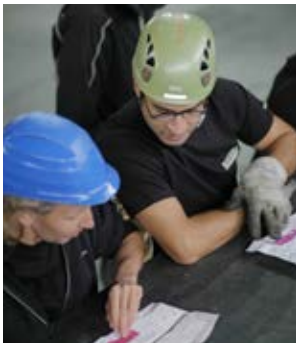
3 Des accords réciproques sont indispensables.