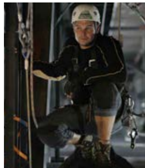
5 Rigger correctement équipé sur le lieu de travail.