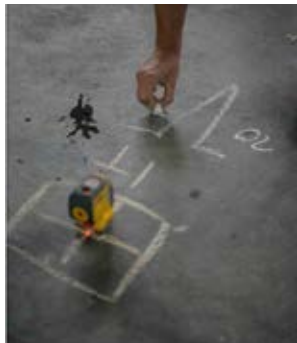
4 Headrigger lors de la préparation du travail et de la planification détaillée.